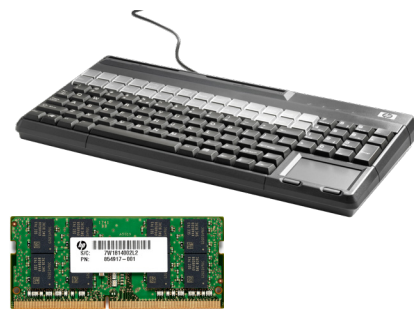
Muut lisävarvikkeet: muistit, kaapelit, kiinnitystelineet, I/O -liitäntäjalustat ja näppäimistö MSR (FK218AA)