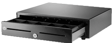
Kassalaatikko Standard Duty (QT457AA)