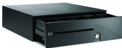
Kassalaatikko Heavy Duty (FK182AA)