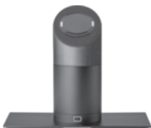
Jalustat musta ja valkoinen (5JG51AA/5JG52AA)