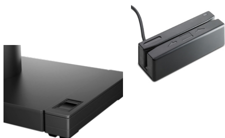
Sormenjälkitunnistimet musta ja valkoinen (1RL98AA/3GS21AA) ja USB-mini-magneettinauhanlukija pidikkeellä (FK186AA)

Kattavilla lisävarusteilla luot tyylikkään myyntiratkaisun. Laajasta oheislaittevalikoimasta löydät tarpeisiisi sopivan ratkaisun - mustana ja valkoisena. Löydät sivun alaosan linkistä tuotekoodeineen kaikki Engage One -yhteensopivat laitteet.