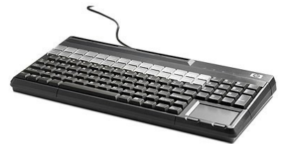
Näppäimistö MSR (FK218AA)