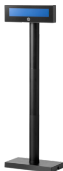
Engage 2X20 -pylväs näyttö (5RD97AA)