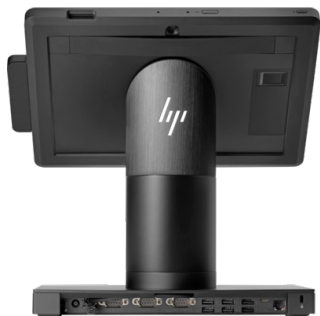
Retail-kotelot musta ja valkoinen (3VM86AA/3VM87AA MSR)

HP Engage Go on muunneltava ja mobiili myyntijärjestelmä, joka sopii moneen eri käyttöön. Mustana tai valkoisena. Löydät sivun alaosan linkistä tuotekoodeineen kaikki Engage Go -yhteensopivat laitteet.