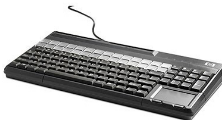
Näppäimistö MSR (FK218AA)