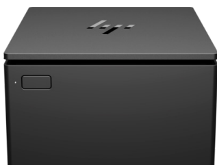
Kuittitulostimet sarja- ja USB-porteilla musta ja valkoinen (1RL96AA/3GS19AA)