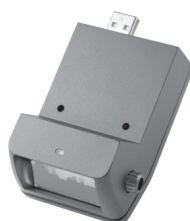
Viivakoodinlukijat: integroidut, langattomat ja langalliset (N3R60AA, N3R61AA, Z1Z36AA, QY439AA, E6P34AA, 5YQ08AA)