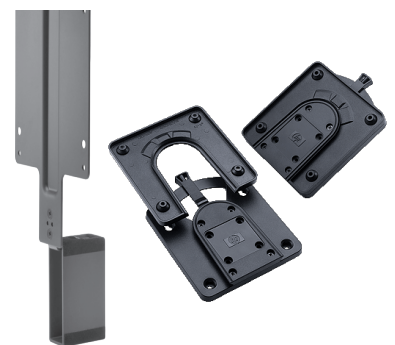
Erlaiset kiinnitysratkaisut (2DW53AA, N6N00AA, EM870AA)