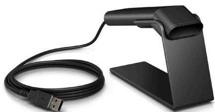
Langalliset ja langattomat viivakoodinlukijat musta ja valkoinen (1RL97AA, 3GS20AA, Z1Z36AA, QY439AA, E6P34AA, 5YQ08AA)