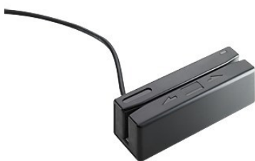
USB-mini-magneettinauhanlukija pidikkeellä (FK186AA)