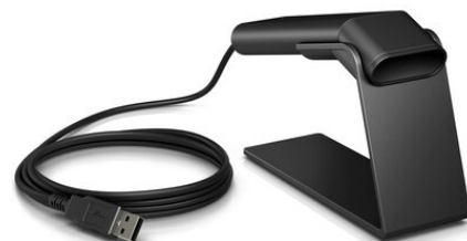
Viivakoodinlukijat musta ja valkoinen (1RL97AA/3GS20AA)