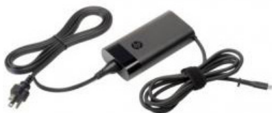
USB-C -virtalähde 115/230V 90W (2LN85AA)