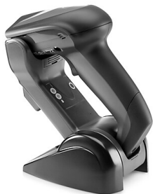
Langaton viivakoodinlukija (E6P34AA)