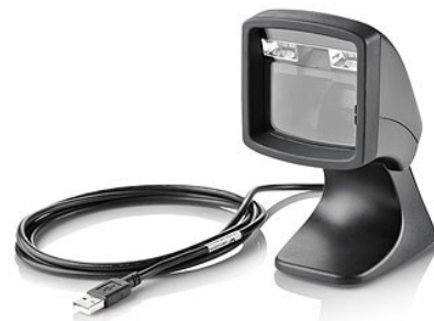
Presentation Barcode Scanner (QY439AA)

KUITTITULOSTIMET: laaja valikoima langallisia ja langattomia kuititulosimia USB/serial/ethernet/hybrid