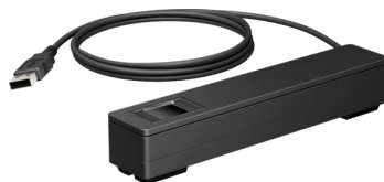
Sormenjälkitunnistimet musta ja valkoinen (1RL98AA/3GS21AA)