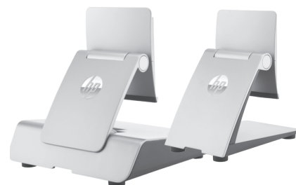
HP RP9 -jalustat: ergonominen (POQ87AA) ja pienikokoinen (POQ88AA)