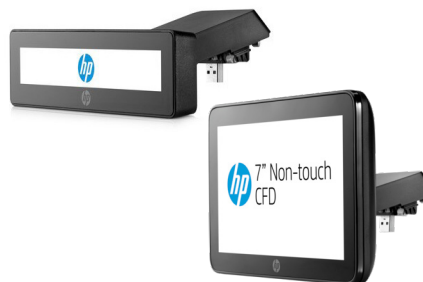
Integroitu 2x20 -näyttö & telinevarsi (P5A55AA) ja 7" NT CFD -näyttö & telinevarsi (P5A56AA)