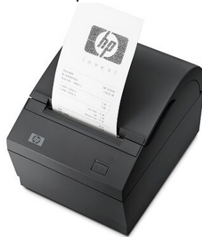
Langalliset ja langattomat kuittitulostimet (D9Z52AA#ABB, M2D54AA#ABB, BM476AA, X3B46AA)