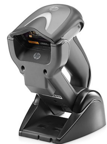
Langalliset ja langattomat viivakoodinlukijat (Z1Z36AA, QY439AA, E6P34AA, 5YQ08AA)