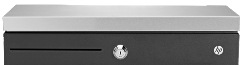
Kassalaatikot (BW867AA, FK182AA, QT457AA, BZ335AA, QT458AA)