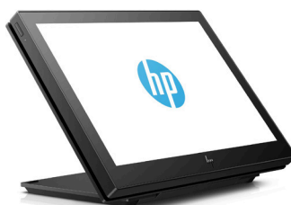
10.1" -kosketusnäytöt musta ja valkoinen (1XD81AA/3FH67AA) sekä 10.1" -näytöt musta ja valkoinen (1XD80AA/3FH66AA)