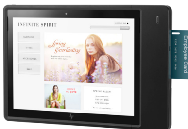
Palvelupistesuojukset ja -kotelot MSR+SCR / OCR+MSR+SCR+BCS / Ingenico ja Verifone PED SKU BCS -aukolla tai ilman