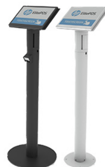
Jalustat musta ja valkoinen

Engage One -varastokoneissamme on 5 vuoden Care Pack -lisätakuu vakiona.