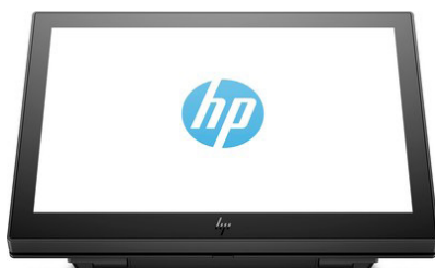
10.1" -kosketusnäytöt musta ja valkoinen (1XD81AA/3FH67AA) sekä 10.1" -näytöt musta ja valkoinen (1XD80AA/3FH66AA)