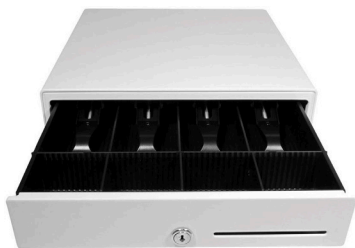
Kassalaatikat musta ja valkoinen (4VW59AA/4VW65AA)

Löydät sivun alaosan linkistä tuotekoodeineen kaikki Engage One Prime -yhteensopivat laitteet.