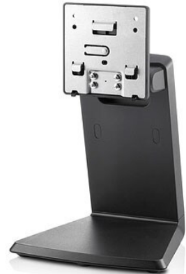
Kahden asennon L6010 -jalusta (A1X79AA)