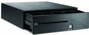
Kassalaatikot (BW867AA, FK182AA, QT457AA, QT458AA)

Monipuoliset oheislaitteet ja kiinnitysmahdollisuudet - voidaan asentaa kalusteisiin tai esimerkiksi näytön taakse. Erinomaiset liitännät ja sopii hyvin kokonsa puolesta haastaviin tiloihin. Löydät sivun alaosan linkistä tuotekoodeineen kaikki MP9 G4 -yhteensopivat laitteet.