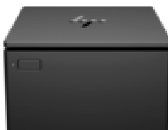
Laaja valikoima erilaisia kuittitulostimia: USB/LAN/ethernet/serial/hybrid