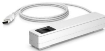
Sormenjälkitunnistimet musta ja valkoinen (4VW57AA/4VW63AA)