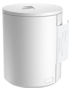
Kuittitulostimet musta ja valkoinen (4VW55AA/4VW61AA)