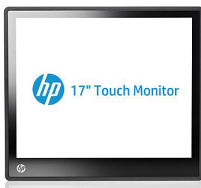
10" - 17" Retail-kosketusnäytöt (A1X76AA, A1X78AA, A1X77AA)