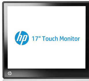
10" - 17" Retail-kosketusnäytöt (A1X76AA, A1X78AA, A1X77AA)