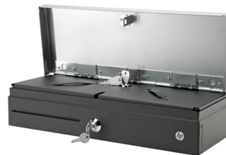
Kassalaatikko Flip Top (BW867AA)