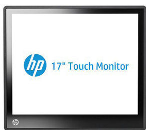
10" - 17" Retail-kosketusnäytöt (A1X76AA, A1X78AA, A1X77AA)