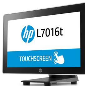
10" - 15.6" LED-kosketusnäytöt (PCAP) (T6N30AA, T6N31AA, T6N32AA, V1X13AA)