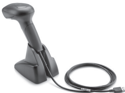
Linear Barcode Scanner II (Z1Z36AA)