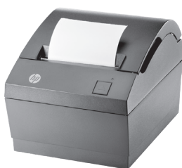
Laaja valikoima erilaisia kuittitulostimia: USB/LAN/ethernet/serial/hybrid