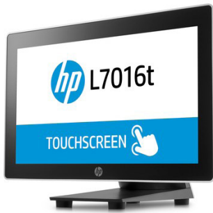
10" - 15.6" LED-kosketusnäytöt (PCAP) (T6N30AA, T6N31AA, T6N32AA, V1X13AA)