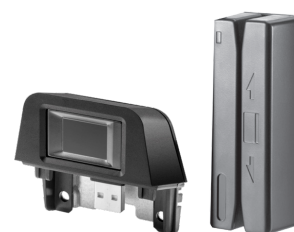
Integroitu sormenjälkitunnistin (N3R64AA) ja USB-mini- magneettinauhanlukija pidikkeellä (FK186AA)