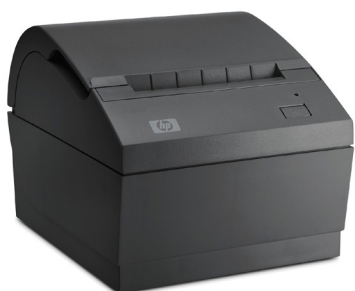
Kuititulosin USB Single Station Thermal (FK224AA)

KUITTITULOSTIMET: laaja valikoima langallisia ja langattomia kuititulosimia USB/serial/ethernet/hybrid