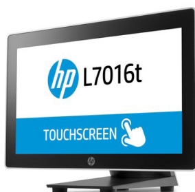
10" - 15.6" LED-kosketusnäytöt (PCAP) (T6N30AA, T6N31AA, T6N32AA, V1X13AA)