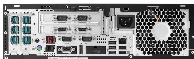
Engage Flex Pro