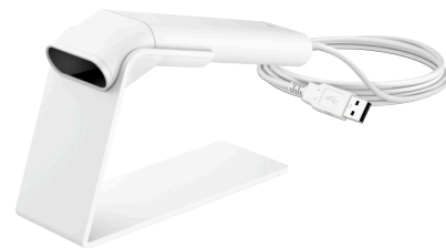
Viivakoodinlukijat musta ja valkoinen (4VW58AA/4VW64AA)